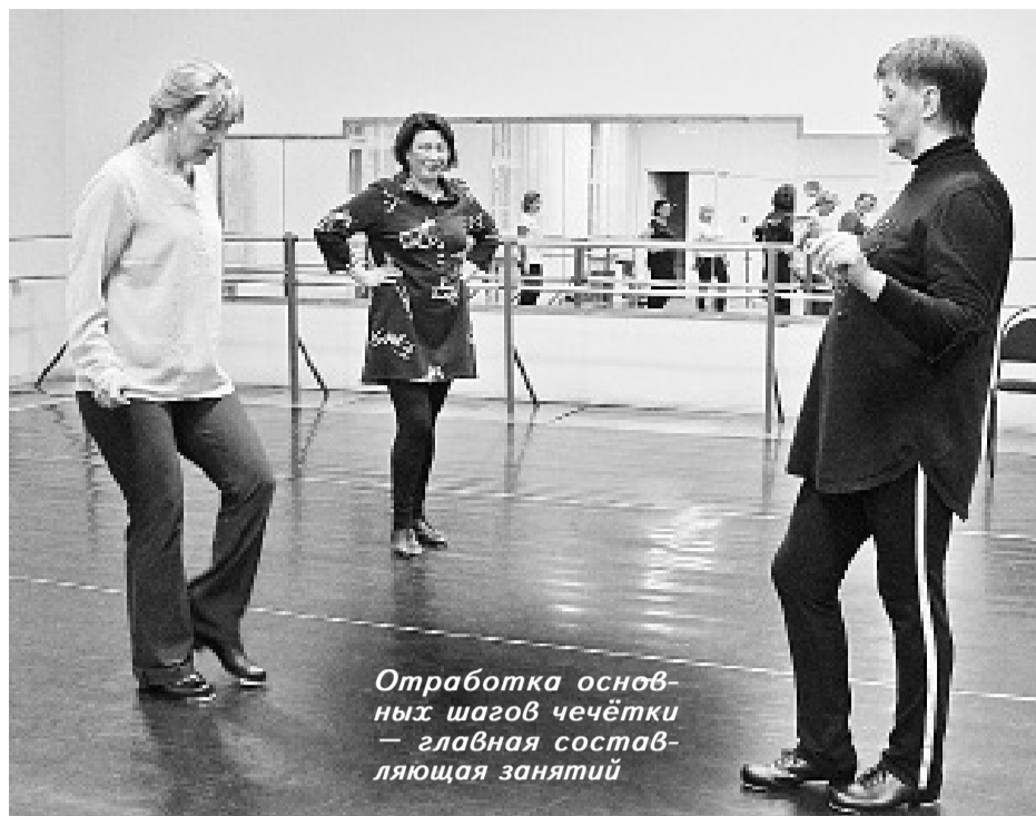
Отработка основных шагов чечётки — главная составляющая занятий