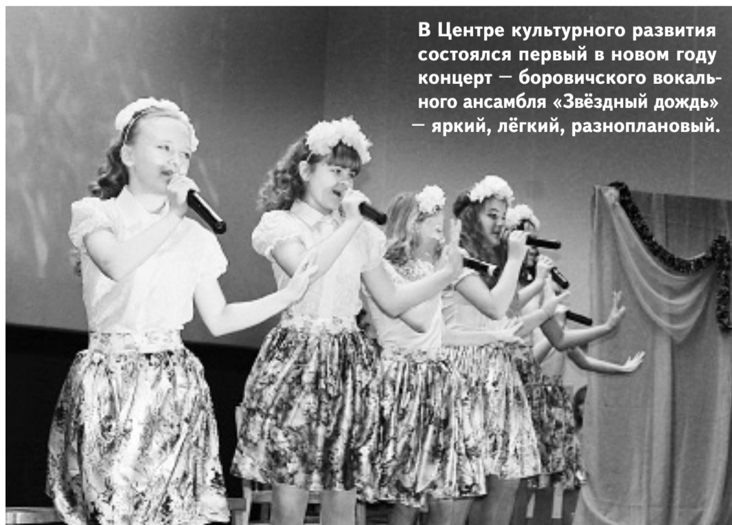
В Центре культурного развития состоялся первый в новом году концерт — боровичского вокального ансамбля «Звёздный дождь» — яркий, лёгкий, разноплановый.