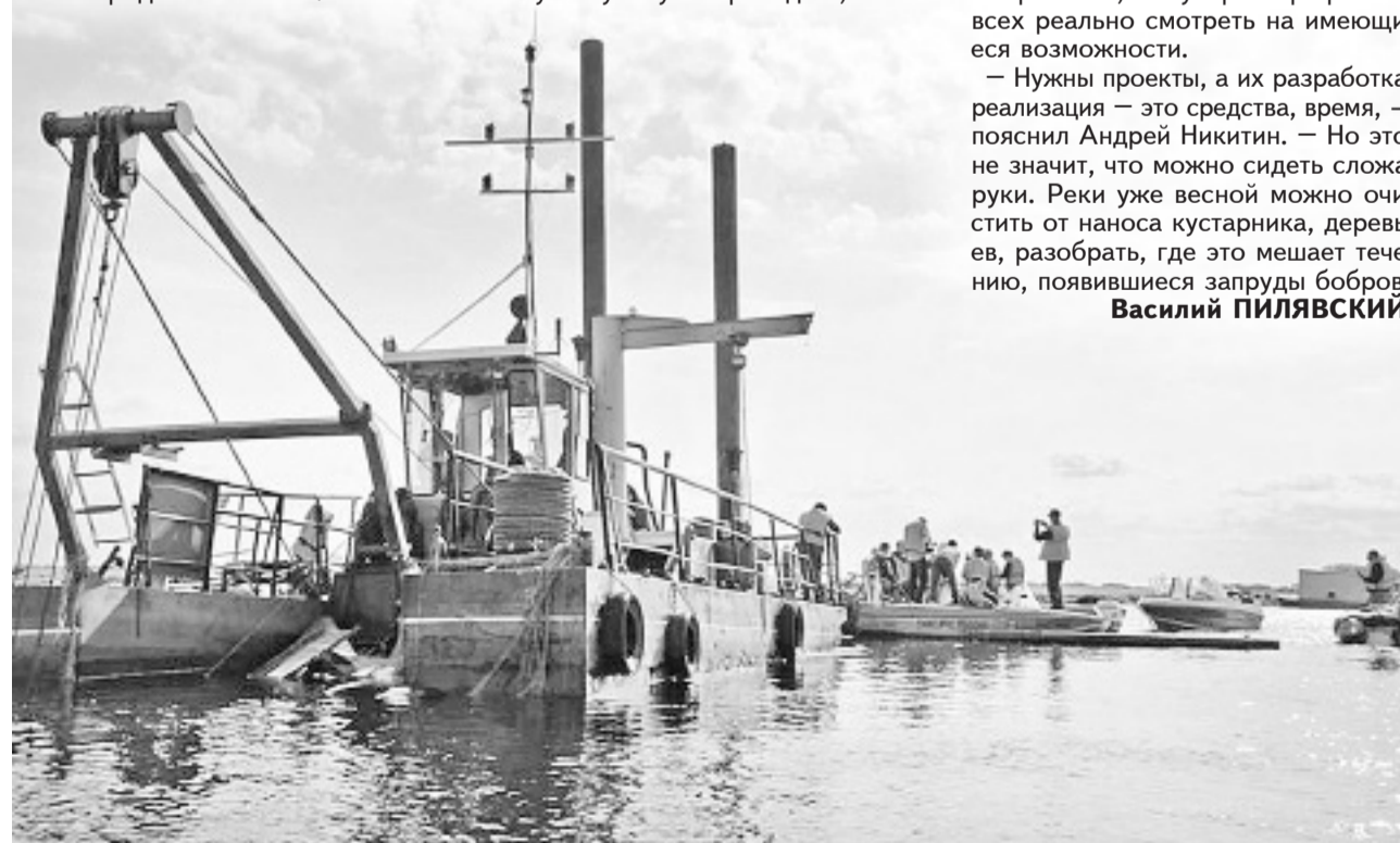
В 2019 году дноуглубительные работы проводились на Ильмене.