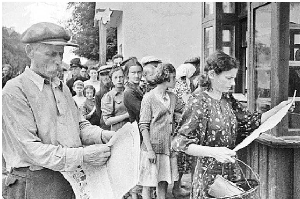
В годы войны у газетного киоска