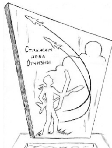
Технический эскиз памятного знака

Инициативная группа предлагает установить в Боровичах памятный знак авиаторам.