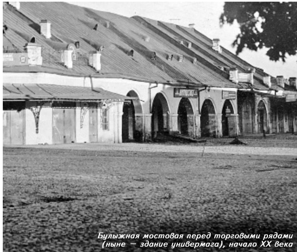
Булыжная мостовая перед торговыми рядами (ныне — здание универмага), начало XX века