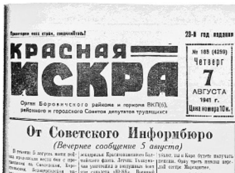
«Красная искра» регулярно публиковала сводки Совинформбюро

* Войска СС — элитные воинские формирования нацистской Германии. Части войск СС принимали участие как в военных действиях, так и в акциях оперативных групп, осуществляющих геноцид.